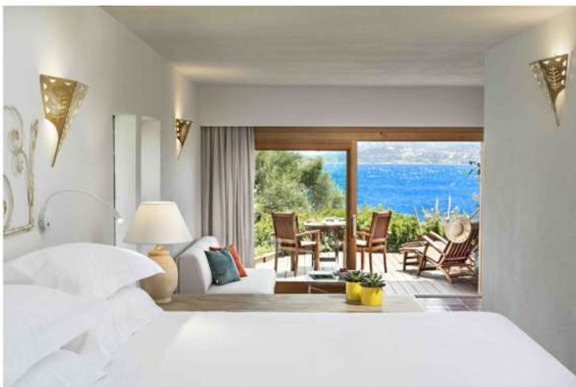
Una Junior Suite Executive vista mare dell’Hotel Capo d’Orso a Palau (SS)

Tra gli investimenti, anche il restyling delle aree benessere e dei giardini. Come il completo rinnovamento della palestra, arrampicata in posizione panoramica sulla scogliera, e l’incremento dell’offerta per i golfisti, ora arricchita da un simulatore professionale. Per cimentarsi virtualmente sui green più ambiti al mondo.