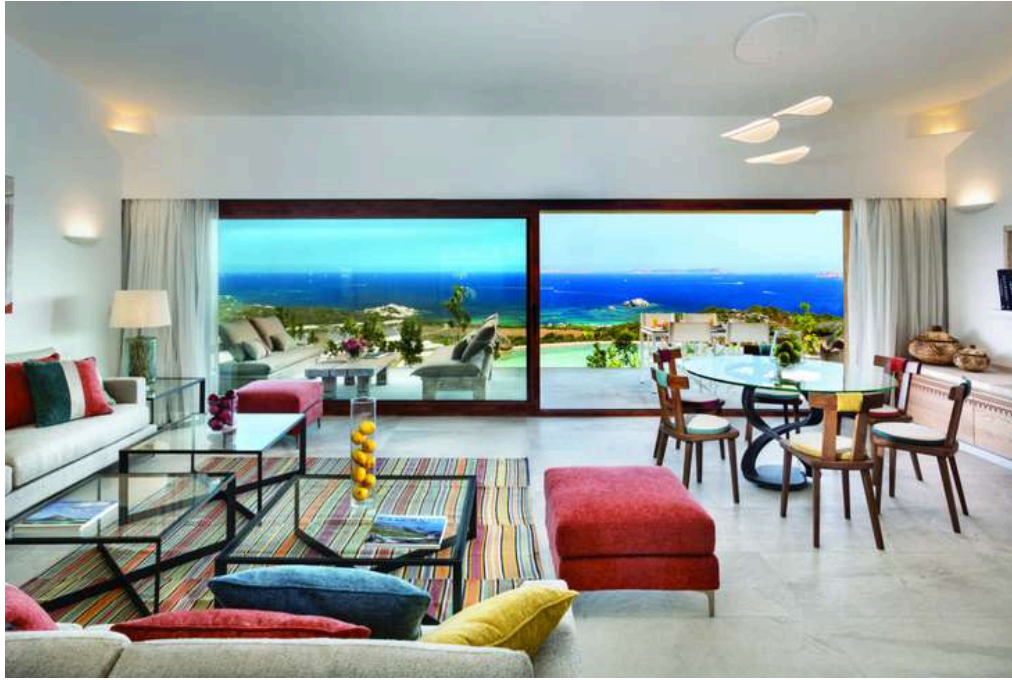
Une suite de la Valle dell'Erica Thalasso &amp; Spa