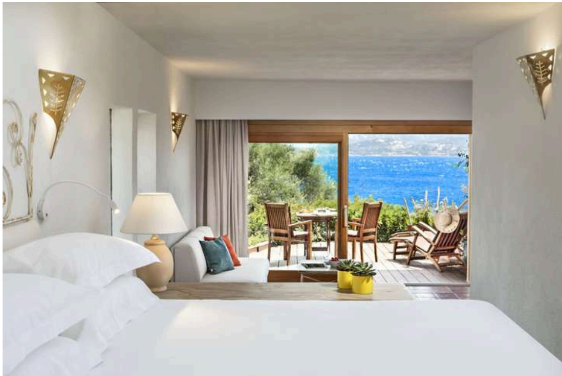
Une des très belles chambre du Capo d'Orso

Les 86 chambres, disséminées comme des cabanes chic dans le maquis, déclinent un style sarde sans chichis : bois naturel, fer forgé, céramiques artisanales. Chaque détail respire l'île. Certaines suites offrent une vue panoramique sur la mer, d'autres donnent sur les jardins fleuris. Et toutes partagent ce sentiment rare d'être dans un lieu pensé pour ralentir. Ici, on vit au rythme du vent et du clapotis, entre un massage au spa L'Incantu, un dîner romantique chez Il Paguro, ou une virée en voilier vintage vers les îles voisines. Une adresse idéale pour les amoureux de nature et d'intimité. En bref, séjourner au Capo d'Orso, c'est renouer avec une idée précieuse du voyage : celle qui ne coche pas des cases, mais ouvre des portes. À la contemplation, au silence, à l'essentiel. C'est aussi une invitation à reconsidérer le luxe non pas comme une accumulation, mais comme un dépouillement — celui qui laisse place à la beauté brute, à l'évidence d'un ciel immense, à la caresse du vent salé sur la peau.