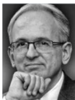
di Leonardo Felician

L e Dune, resort del gruppo Delphina, è uno dei più completi in Sardegna, situato all'interno di un parco sul golfo dell'Asinara.